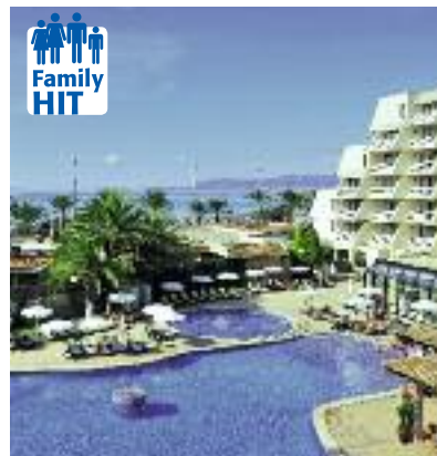
Spanien & Portugal SO 2014 Seite 85 Code: FOLA 11463 B 2A OV/FR/HP