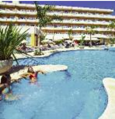
Preisknüller Sonne & Meer SO 2014 Seite 10 Code: FOLA 11628 A 2D HP