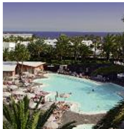
Kanarische Inseln & Kapverden SO 2014 S. 140 Code: FOLA 20319 A 2A AI