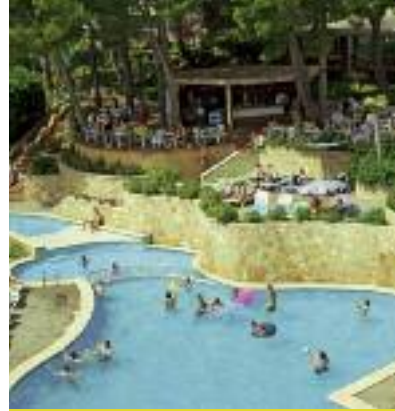
Spanien & Portugal SO 2014 Seite 38 Code: FOLA 11822 A 2S HP/AI