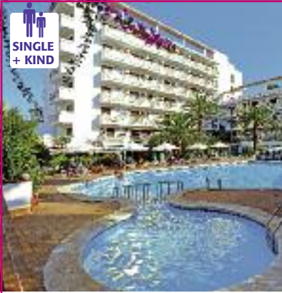
Spanien & Portugal SO 2014 Seite 81 Code: FOLA 11419 A 2A HP/VP