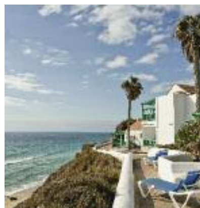
ALDIANA SO 2014 ab Seite 70 Code: FOLA 22220 T 2A AI