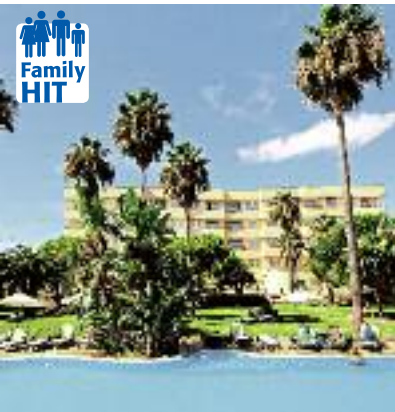
Spanien & Portugal SO 2014 Seite 53 Code: FOLA 11247 A 2A AI