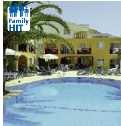
Spanien & Portugal SO 2014 Seite 49 Code: FOLA 11631 A 2A AI