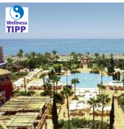
Spanien & Portugal SO 2014 Seite 169 Code: FOLA 17113 A 2A HP