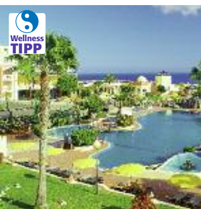
Kanarische Inseln & Kapverden SO 2014 S. 74 Code: FOLA 22322 A 2S HP/AI