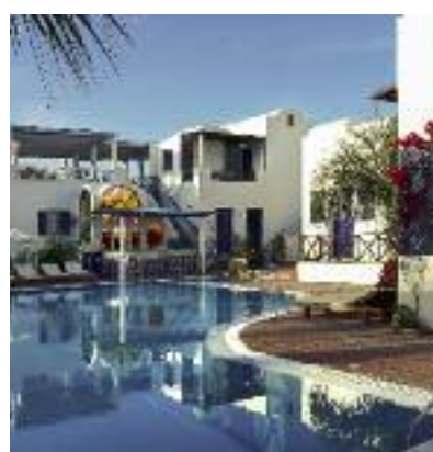
Griechenland & Zypern SO 2014 Seite 170 Code: FOLA 51131 A 2A FR