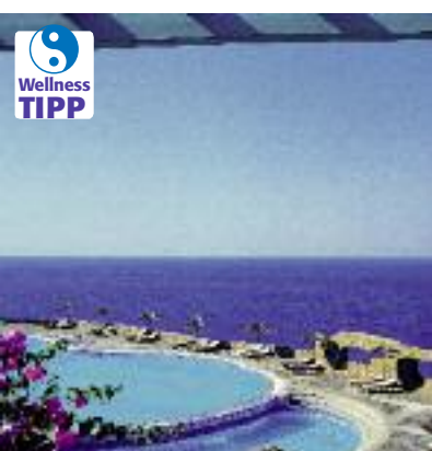
Griechenland & Zypern SO 2014 Seite 174 Code: FOLA 53652 A 2E FR/HP